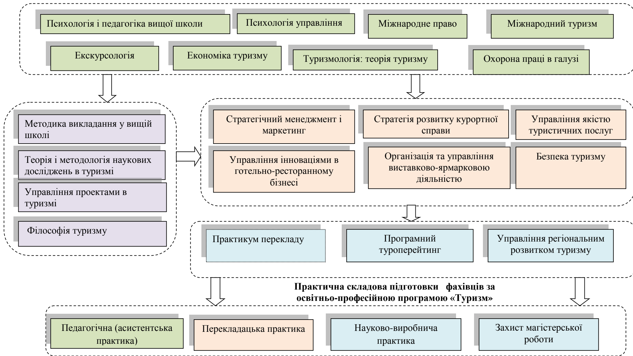
Рис. 1. Структурно-логічна схема підготовки фахівців за освітньо-професійною програмою «Туризм»